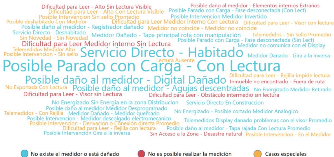
Ilustración 2 Anomalías asociadas a condiciones aplicables identificadas por ENEE

Se observó que el 85% de los promedios fueron clasificados por la empresa con la condición aplicable “no existe de el medidor o está dañado”, no obstante, dentro de esos casos la empresa asoció anomalías que describen “posibles” daños a equipos de medición, dificultad de lectura, equipos no accesibles, servicios directos, entre otros.